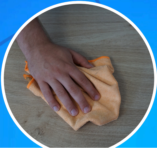
REINIGEN SIE DIE OBERFLÄCHE

Der LED-Streifen verfügt über einen Klebestreifen über die gesamte Länge, sodass Sie ihn einfach montieren können.