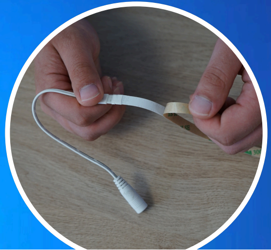
ENTFERNEN SIE DIE SCHUTZFOLIE